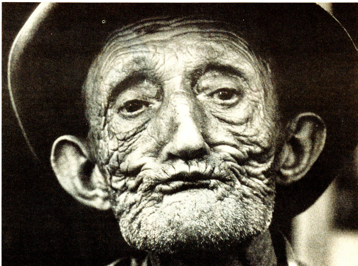
C'est un bon petit vieux ratatiné comme une pomme reinette au printemps. Photo Alberto Flammer, extraite du livre de Piero Bianconi «Occhi sul Ticino», ed. A. Dado.

Certes, pour être «medico condotto» dans une vallée, à cette époque, il fallait avoir le goût de la marche. En effet, après avoir terminé sa visite au bord du torrent, nos deux «missionnaires de la santé» remontent le ravin vers le sommet d'une colline, où un autre patient attend, et de là ils se dirigent à l'alpe surplombant le village, voir une femme anémique, en traitement depuis longtemps: «Sa maladie semble être surtout la misère; le manque d'appétit provient chez elle du manque de nourriture convenable. A notre dernier passage, le docteur lui avait remis deux bouteilles d'extrait de viande Maggi, en l'assurant que chaque fiole valait plus de 10 francs. Il fallait donc constater l'effet magique