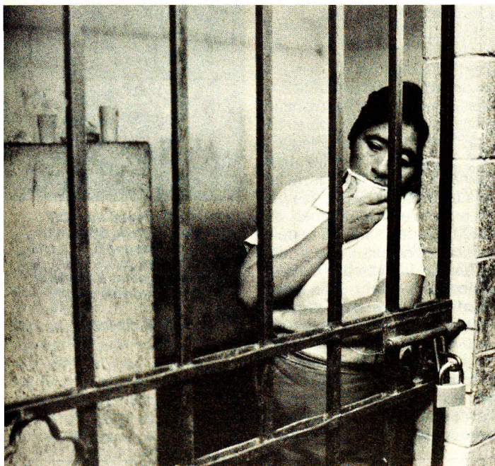
Pour ceux qui subissent la torture, il n'y a rien de pire que d'imaginer l'ignorance du monde extérieur.

● Pour des raisons de sécurité de l'Etat, les Etats signataires peuvent suspendre temporairement les visites des membres du Comité. Ils ne peuvent toutefois imposer des restrictions de longue durée.