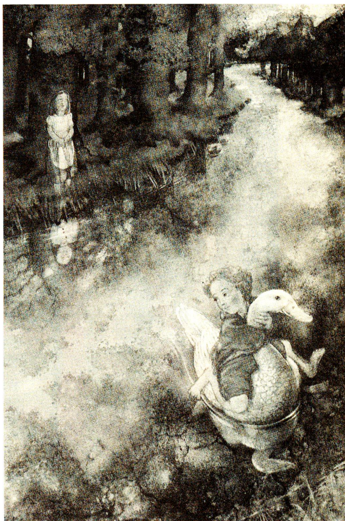
«Un jour, les petites filles sages veulent s'évader.»

Monique Félix vit cette déchirure dans ses illustrations de livres pour enfants et dans ses dessins pour adultes encore trop rares, qui parlent à nos consciences d'adultes. □