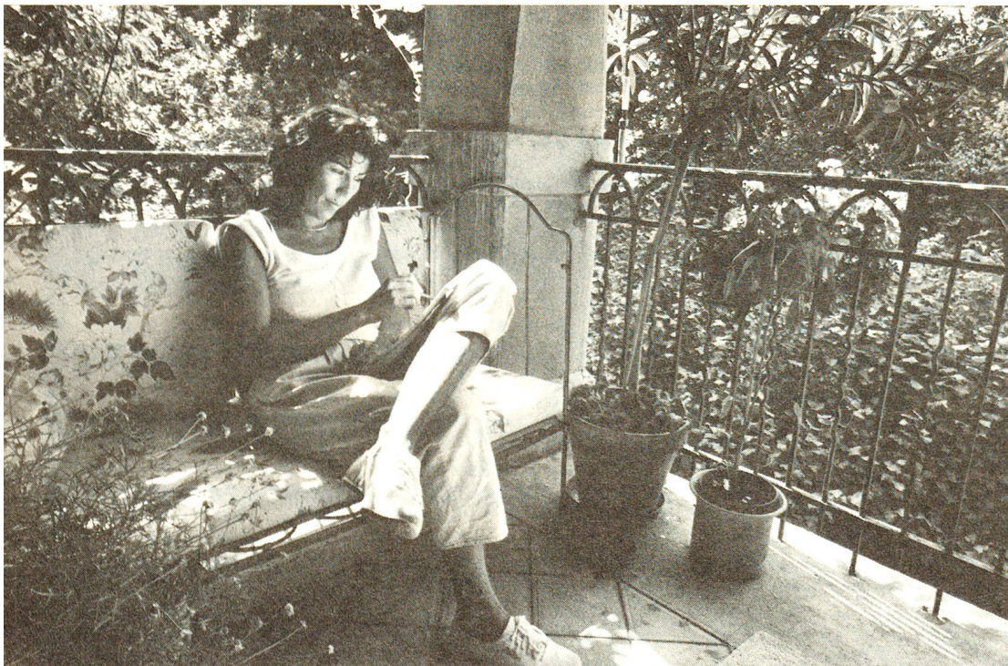
Son atelier s'ouvre sur les frondaisons du parc.

percer le mystère en franchissant les montagnes, m'a fait penser au mythe de la caverne de Platon et à sa leçon philosophique: toute vérité est souffrance. Ceux qui aujourd'hui doivent subir cette épreuve abjecte paient souvent ainsi