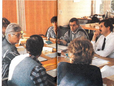
«Je trouve que...» Le travail de groupe permet le dialogue et l'échange de points de vue.

Les journées consacrées à cet objectif ne sont pas seulement l'occasion d'un échange d'informations entre secrétariat central et sections, mais permettent aussi aux différents collaborateurs de parler de leurs expériences. Afin d'encourager une telle démarche, plusieurs réunions au-