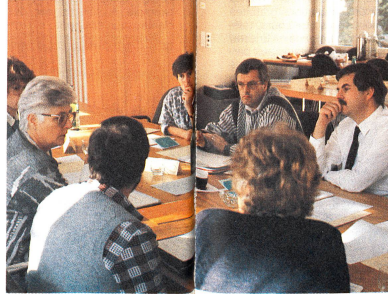
«Je trouve que...»: Le travail de groupe permet le dialogue et l'échange de points de vue.

Les journées consacrées à cet objectif ne sont pas seulement l'occasion d'un échange d'informations entre secrétariat central et sections, mais permettent aussi aux différents collaborateurs de parler de leurs expériences. Afin d'encourager une telle démarche, plusieurs réunions au-