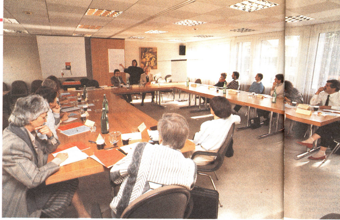
L'éventail des cours CRS en 1988

En sa qualité d'organisation humanitaire sans but lucratif, la Croix-Rouge suisse poursuit deux objectifs dans son projet de perfectionnement professionnel. Premièrement, elle tient à améliorer ses prestations de service sur le plan qualitatif et quantitatif, en complétant ou en diversifiant la formation de ses collaborateurs. Deuxièmement, elle cherche à encourager les discussions sur les problèmes personnels et les difficultés de communication, afin d'y remédier à l'aide de solutions adaptées décidées en commun