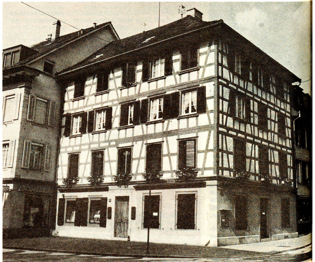
Cette superbe maison à colombages de la «Metzggasse» à Winterthur abrite cinq organisations d'entraide, dont la Croix-Rouge suisse.

Le président n'est pas encore parvenu à résoudre le problème de la recherche de fonds, qui lui tient pourtant à cœur. L'objectif à long terme qu'il s'est fixé est d'abandonner l'application des méthodes raffinées de marketing, une manière certes efficace de récolter de l'argent, mais qui lui est des plus désagréable. En contrepartie des dons, il préférerait donner une bonne information sur les activités en cours, éventuellement même offrir des prestations gratuites à choix, telles que cours, téléphone d'urgence Ericare, soins ou ergothérapie aux personnes qui sont membres Croix-Rouge depuis un certain nombre d'années. Son intention est d'exposer ce pro-