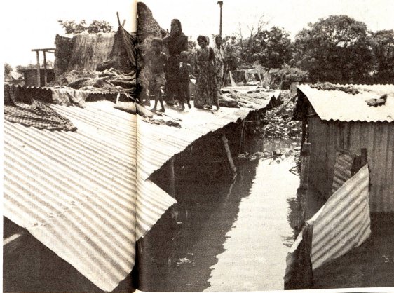
Un faubourg de Dacca en septembre 1987. Après les plus graves inondations jamais connues, les gens ont vécu pendant des semaines sur les toits.

– Tous reçoivent une information sur les affaires importantes. Les connaissances (Suite en page 23)