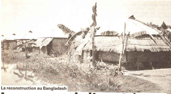
La reconstruction au Bangladesh