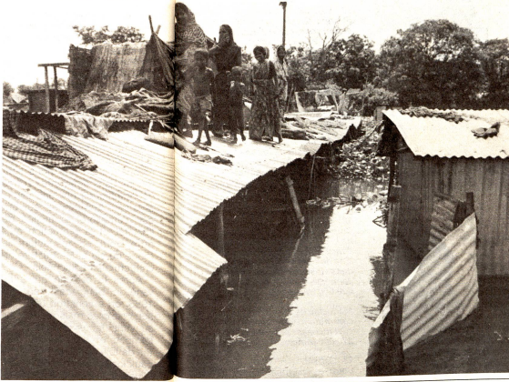
Un faubourg de Dacca en septembre 1987. Après les plus graves inondations jamais connues, les gens ont vécu pendant semaines sur les toits.

– Tous reçoivent une information sur les affaires importantes. Les connaissances (Suite en page 23)