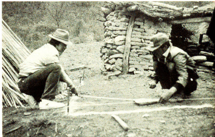
Les premières mesures d'assainissement des habitations sont entreprises sous surveillance, avec des matériaux trouvés sur place.

Et qu'en est-il des réduves? Lors d'un séminaire organisé en mars passé à Redención Pampa, l'un des thèmes abordés était celui du travail de l'équipe de la CRS. Deux groupes de travail formés de douze paysannes et paysans