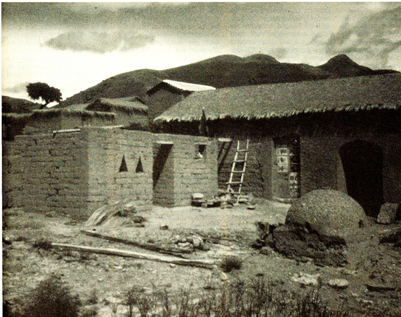
Les paysans prennent quelquefois eux-mêmes l'initiative de boucher avec du crépi les fentes qui se trouvent sous le toit de paille et qui sont les refuges privilégiés des réduves.

C'est ainsi que, grâce au travail des deux étudiants, de nombreux paysans bénéficient d'un enseignement pratique. Au cas où leurs efforts porteraient des fruits et conduiraient à des modifications architectoniques systématiques, il se pourrait qu'un jour, les paysans de la vallée puissent dormir en toute quiétude dans leurs maisons sans craindre la maladie de Chagas. □