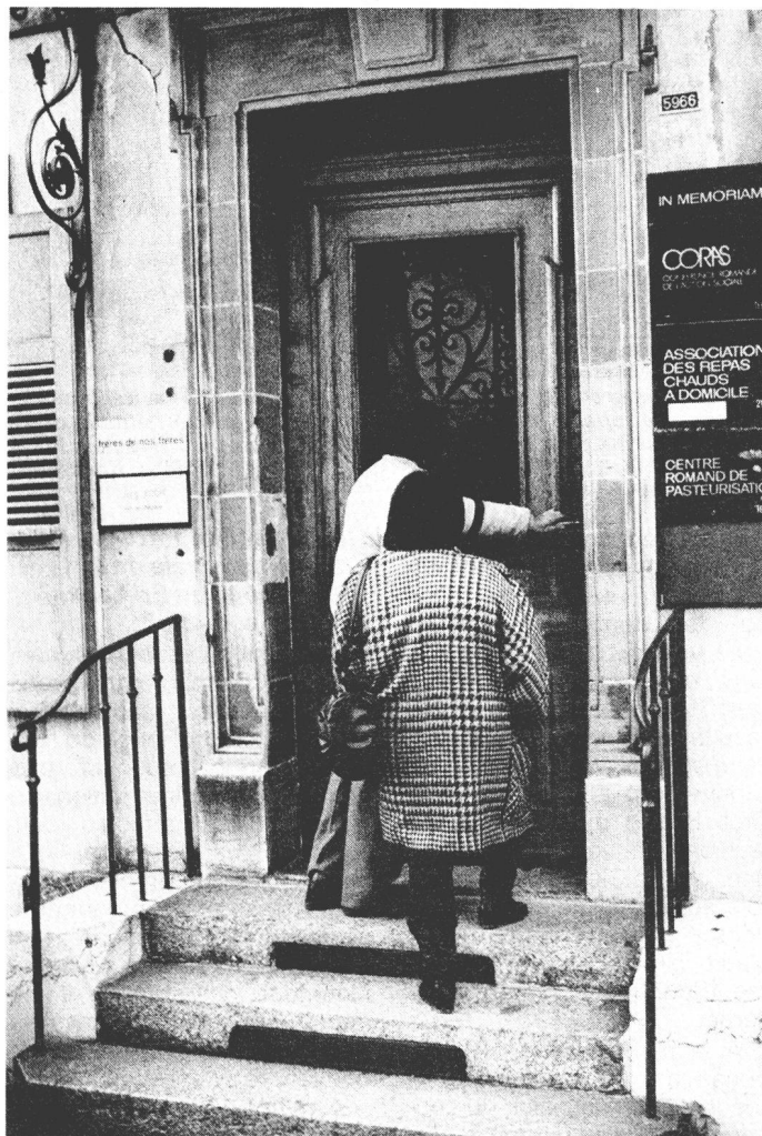
Au No 2 de l'avenue de Rumine à Lausanne, une agence de voyages pas comme les autres.

Ils ont craqué ou ont été refusés: beaucoup d'anciens requérants quittent la Suisse et son paradis perdu. Pour rentrer au pays ou tenter une nouvelle destination. Une agence de voyages très particulière, la Croix-Rouge suisse, les replace sur orbite.