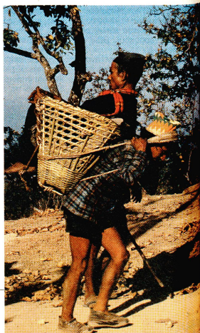
En chemin vers le «Eye Camp».