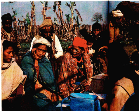
Enfin arrivés! Les patients et leurs proches attendent la consultation.

L'année dernière, 8935 personnes ont fait don de leur vieil or à la CRS. Le poids total de cet or a atteint 20 kg, dépassant ainsi de plus d'un tiers la quantité récoltée l'année précédente. Depuis le début de l'action «Vieil or», un grand nombre de personnes ont pu recouvrer la vue. Des milliers d'autres attendent encore qu'on puisse les aider. Des sachets jaunes prévus pour l'envoi du vieil or et des fiches d'information peuvent être retirés auprès de la Croix-Rouge suisse, Rainmattstrasse 10, 3001 Berne.