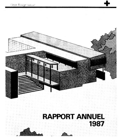
RAPPORT ANNUEL 1987

l'aide de la CRS (45 en 1986) et 47 délégués ont été envoyés sur le terrain (50 l'année précédente) soit pour organiser les secours d'urgence, soit pour effectuer un travail de construction, l'assistance médicale, le développement de centres de transfusion et le renforcement de Sociétés nationales de la Croix-Rouge; 8 pays touchés par des catastrophes ont bénéficié de secours d'urgence.