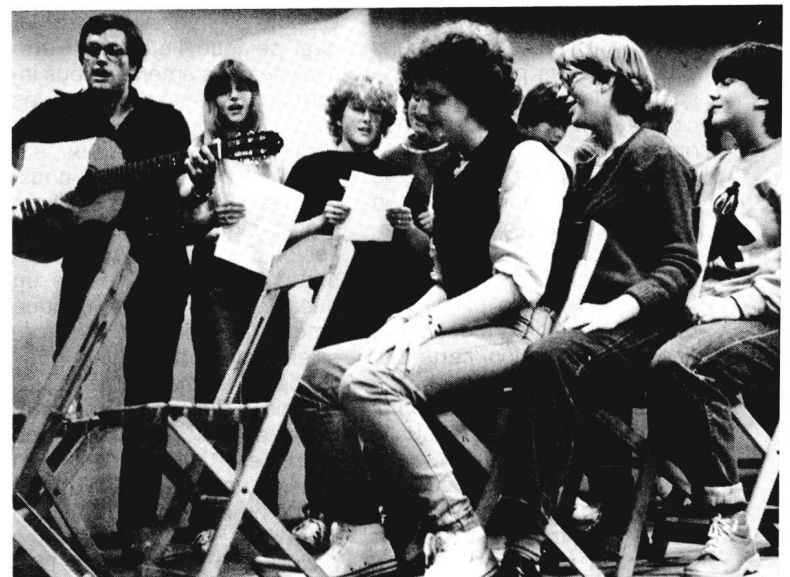
Lenk 1982. Au camp, les loisirs sont aussi organisés et partagés entre tous.