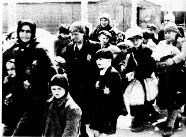
Arrivée d'enfants juifs à Auschwitz. «C'est avec tremblement et respect que je fais revivre ce temps.»

Lorsqu'en décembre 1941 la CRS prend en main le Secours aux Enfants, l'activité de cette organisation s'intensifie, grâce évidemment aux res-