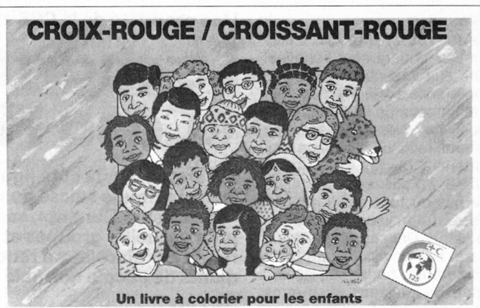
Un livre à colorier pour les enfants UN LIVRE A COLORIER POUR LES ENFANTS Un livre à colorier pour enfants de 4 à 9 ans a été officiellement présenté lors du Festival de Sierre. Ce livre, dont les dessins sont dus au talent du dessinateur zurichois Jurg Obrist, présente les activités du mouvement dans les différentes parties du monde. Il sera édité en six langues et distribué à 120 000 exemplaires dans le monde entier. Il peut être commandé auprès du CICR, Service des publications, 17, Avenue de la Paix, 1211 Genève.

Egalement éditée par le CICR, cette bande dessinée sur l'histoire de la Croix-Rouge et du Croissant-Rouge est disponible dans des langues rares comme l'amharique ou l'oromigna, parlées en Ethiopie.