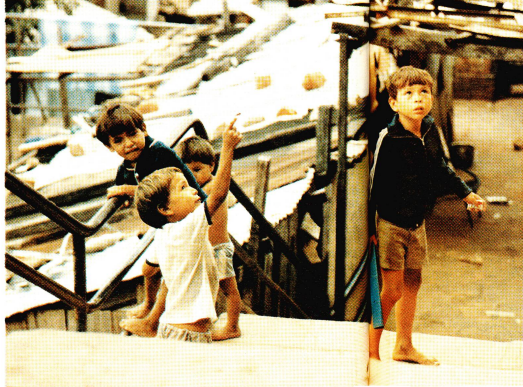
Nos images ont été prises par la cinéaste suédoise Marianne Ahme dans les rues d'Asunción. Elles parlent d'elles-mêmes. Pour cette raison nous renonçons ici à les accompagner de légendes.

Le mot de «Callescuela» qui se compose de «callo» la rue et de «escuela», l'école, signifie l'école dans la rue aussi bien que l'école de la rue. Fondée l'année dernière, cette institution ne cherche pas à retirer les enfants des rues. En raison d'une situation économique qui contraint les familles à envoyer leurs enfants dans la rue pour survivre, l'ins-