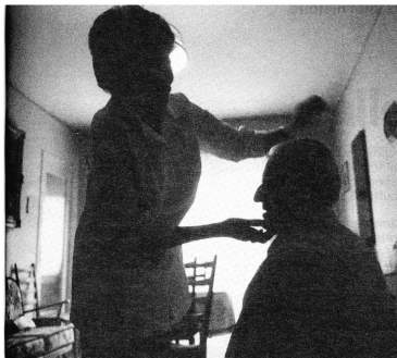
Auxiliaire de santé Croix-Rouge au travail chez un patient de la Ville de Lausanne. Le service d'aide à domicile emploie plus de 130 auxiliaires de santé et est devenu le point fort des activités de la section.

qui doivent faire face à une augmentation continue de la demande. Ce sont ainsi plus de 8400 heures de garde qui ont été assurées en 1987 contre 1105 l'année précédente, ce qui correspond à une augmentation de près de 700% de la demande!