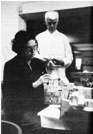
Bénévoles du Service médicaments au cours d'une opération de tri pour un envoi destiné à un pays du tiers monde. Le bénévolat reste l'une des forces de la section et les activités bénévoles devraient être favorisées ces prochaines années.

Le service de «Baby-sitting» est lui aussi en pleine expansion. Créé en 1977, il compte aujourd'hui 106 baby-sitters