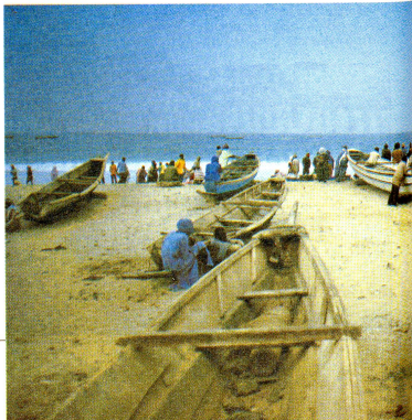
La vita ritorna anche in riva al lago Ciad, immensa distesa d'acqua nel mezzo del continente africano.

Dalla data dell'indipendenza, da oltre vent'anni dunque, la guerra civile erompe, seppure con diversa intensità, senza interruzioni, a volte al nord, a volte al sud, ed il Ciad diventa sempre più il territorio dove vengono combattuti, per interposta persona, conflitti internazionali che travalicano di gran lunga le divergenze politiche interne delle opposte fazioni. □