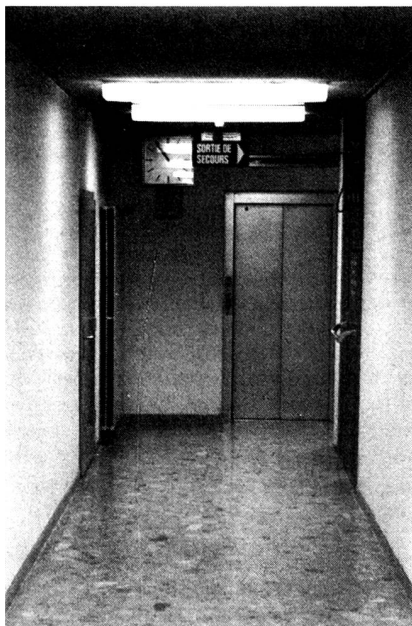
Pulita, linda, ordinata, asettica origine di un crimine.

inquinato da tensioni personali ritorna nelle considerazioni di un'altra lettrice che si chiede: «Sono stati investiti in pari quantità soldi e tempo per migliorare la comunicazione interpersonale come per gli studi di razionalizzazione della ditta Hayek?» Ancora più critico un terzo lettore che con molto acume annota: «È questo uno dei pochi casi dove si evidenzia la malattia della nostra società, dove fama, onore e carriera professionale rappresentano il maggiore obiettivo della vita, ma dove l'umanità non ha più posto (...). Per i più la fine viene raggiunta quando nella scalata professionale si arriva finalmente il gradino dell'incapacità; lo stress è allora tale che ogni critica ha conseguenze catastrofiche. Normalmente le conseguenze non sono così evidenti come nel caso del bagno di sangue del dicastero delle costruzioni; si indirizzano invece verso il lato interiore delle persone e qui si va a finire nell'infarto cardiaco, nelle tossicomanie e altre sofferenze fisiche o psichiche.»