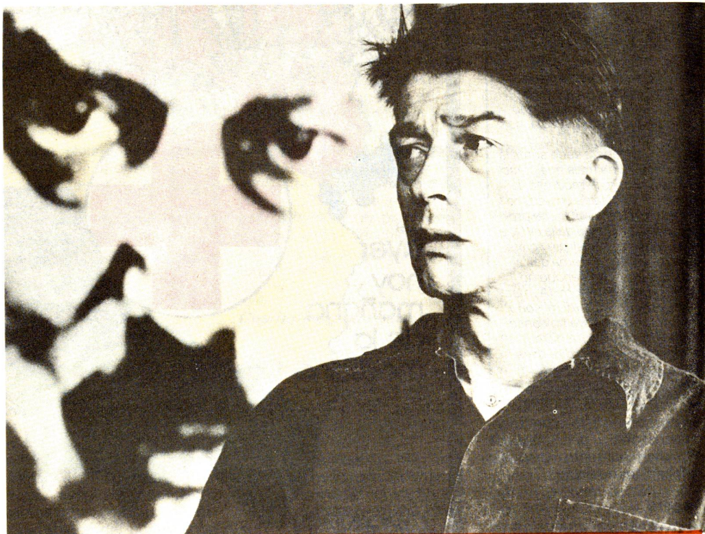
«Big Brother» contro l'impiegato frustrato...!

distruggere una persona.» Sulle onde di Radio 24 si era espresso sul caso lo psicologo Emanuel Hurwitz, ed ecco che sul Tages-Anzeiger viene pubblicata una lettera dove si afferma «Condivido l'interpretazione dei fatti di Emanuel Hurwitz, che considera l'articolo della Züri-Woche come la molla che ha fatto scattare il bagno di sangue. Si è trattato veramente di un articolo incredibilmente perfido e maligno, esat-