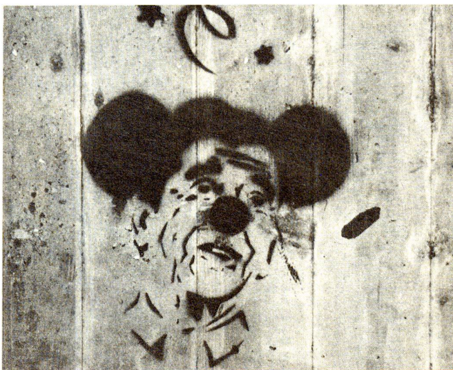
Rappresentazione comico-tragica di funzionario con cemento.

Tra il pubblico che ha assunto la «difesa d'ufficio» di Günther Tschanun si è ripetuta più volte una vera e propria requisitoria verso il posto di lavoro, teatro non solo a Zurigo di tensioni, invidie e frustrazioni degli impiegati. «Il dramma si è sviluppato in una sezione dell'amministrazione dove regnava un clima di lavoro pessimo. Motivo di tutto ciò la imminente ristrutturazione per rendere più efficiente il dicastero, proposte che fin dall'inizio avevano trovato l'opposizione del personale», si legge in una lettera a un quotidiano zurighese. Quello dell'ambiente di lavoro