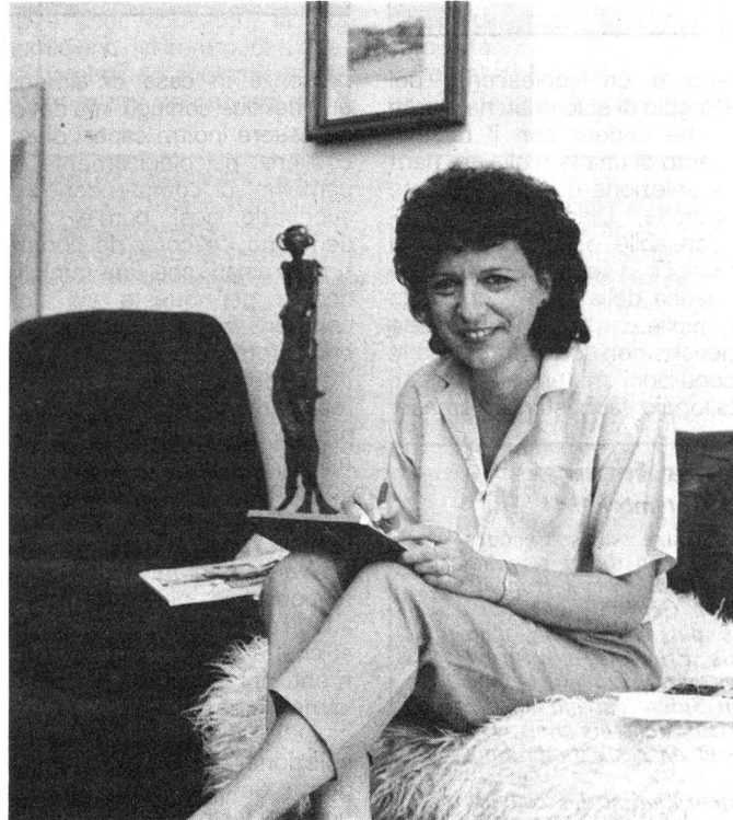
Sylva Nova: il sorriso del sud...