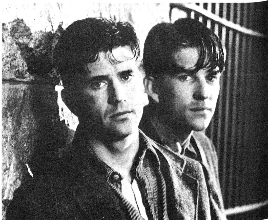
Perché non utilizzare questi giovani, spesso volenterosi, per appoggiare le attività della Croce Rossa?

ad analizzare delle misure meno severe per i renitenti. Ed in effetti la revisione del Codice Penale Militare del 1950 pre-