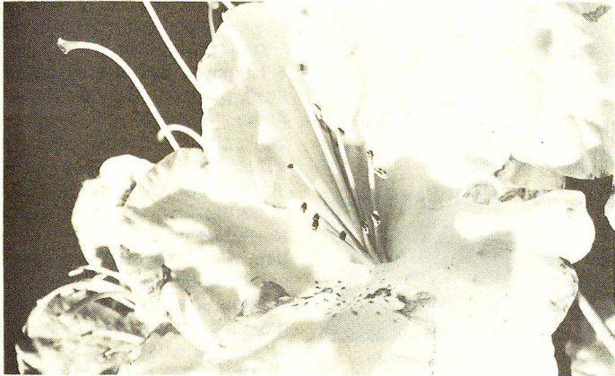
Per la «Giornata del Malato», come di consueto, gli assistenti benevoli della Croce Rossa hanno offerto mazzi di fiori a ventimila malati cronici curati all'ospedale, in case di cura oppure a domicilio.

segnalare al paziente le possibili conseguenze dell'operazione prevista, affinché il paziente stesso potesse scegliere, a tali condizioni, di rifiutare l'intervento e di chiedere una cura diversa, secondo altri metodi.