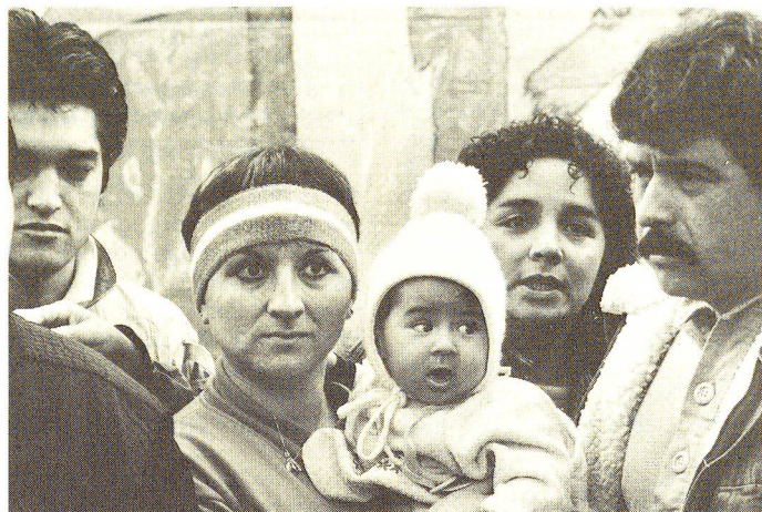
Rifugiati cileni, minacciati d'espulsione, hanno trovato scampo nella parrocchia di Seebach (ZH). I richiedenti con poche probabilità di vedersi concedere l'asilo verranno consigliati sulle modalità del ritorno nel loro paese o della partenza verso un altro paese.

Fino al 1981, anno in cui entrò in vigore la legge federale sull'asilo, la politica praticata dalla Confederazione nell'ambito dei rifugiati faceva riferimento solamente alla Convenzione internazionale del 28 luglio 1951 relativa allo statuto dei rifugiati e veniva concretizzata in base a disposizioni enunciate dal Consiglio federa-