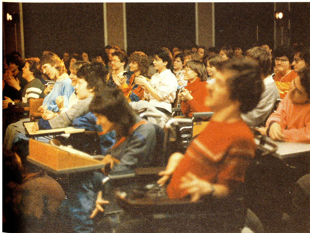
Il pubblico presente era vivamente coinvolto nei fatti vissuti sulla scena, dove si rappresentavano le vere vicende della loro vita.