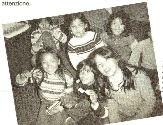
«Rifugiati tibetani in Svizzera», un padrinato che consente di sostenere questa fascia di rifugiati priva, nella maggior parte dei casi, dei sussidi della Confederazione.

Sono già molti i genitori tibetani che si possono rallegrare del felice risultato degli esami di apprendistato sostenuti dai