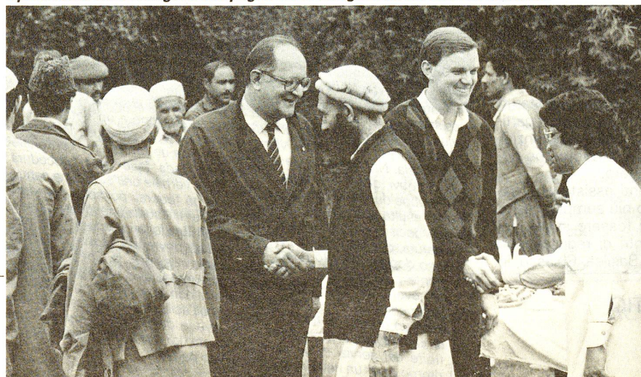
Il presidente Sommaruga in compagnia della delegazione del CICR a Peshawar.

Per quel che mi riguarda personalmente la mia trilogia ha senza dubbio anche il suo riscontro nella mia vita personale e nella mia vita familiare. Per quel che riguarda la mia famiglia non ho mai voluto imporre nulla, e lascio chiunque libero di seguire la sua linea. Direi comunque, e questo con un pizzico di soddisfazione, che ognuno dei miei figli e soprattutto mia moglie sono sulla linea del pater familias. □