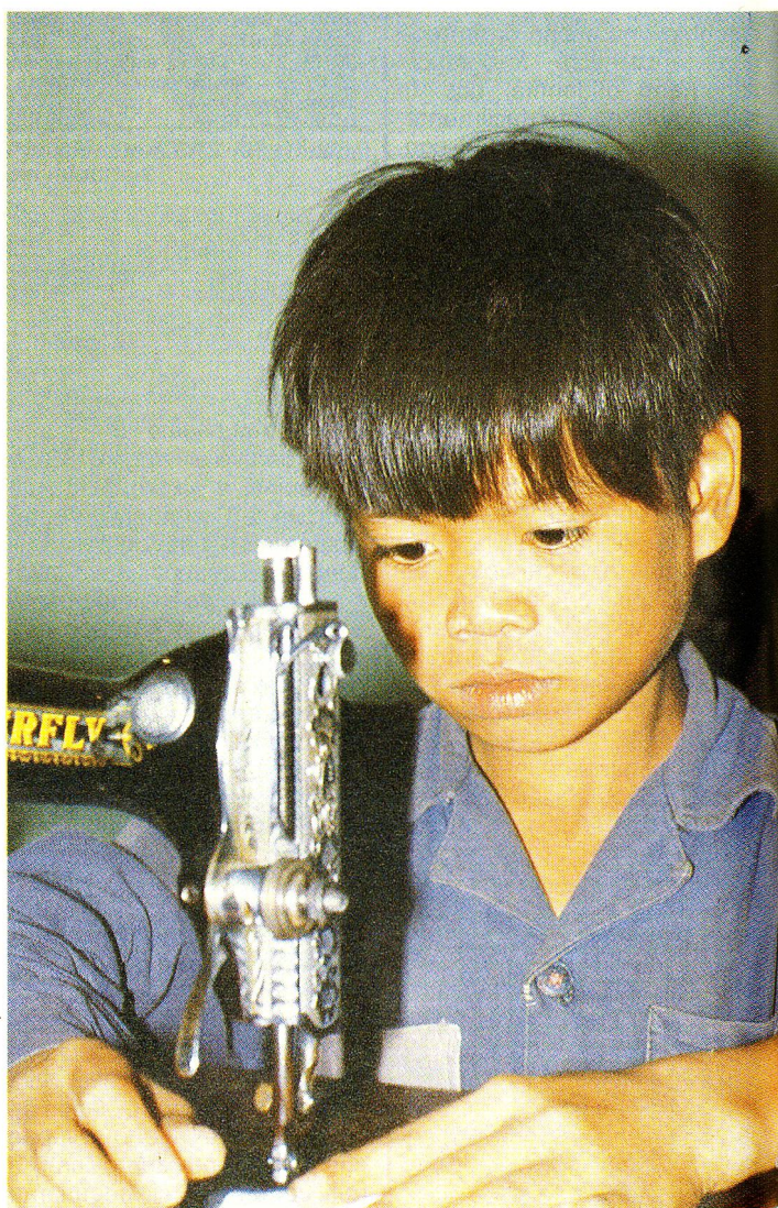
Nel centro di reintegrazione a Thuy An, nelle vicinanze del capoluogo di Hanoi, i bambini vittime della guerra ricevono l'assistenza e l'istruzione necessarie per il loro reinserimento sociale.

delle risorse esistenti e migliorano la produttività individuale e collettiva. Un nuovo progetto che prevede la costruzione di un ospedale nel distretto di Tinh-Biên, provincia di An-Giang, per i suoi circa 80 000