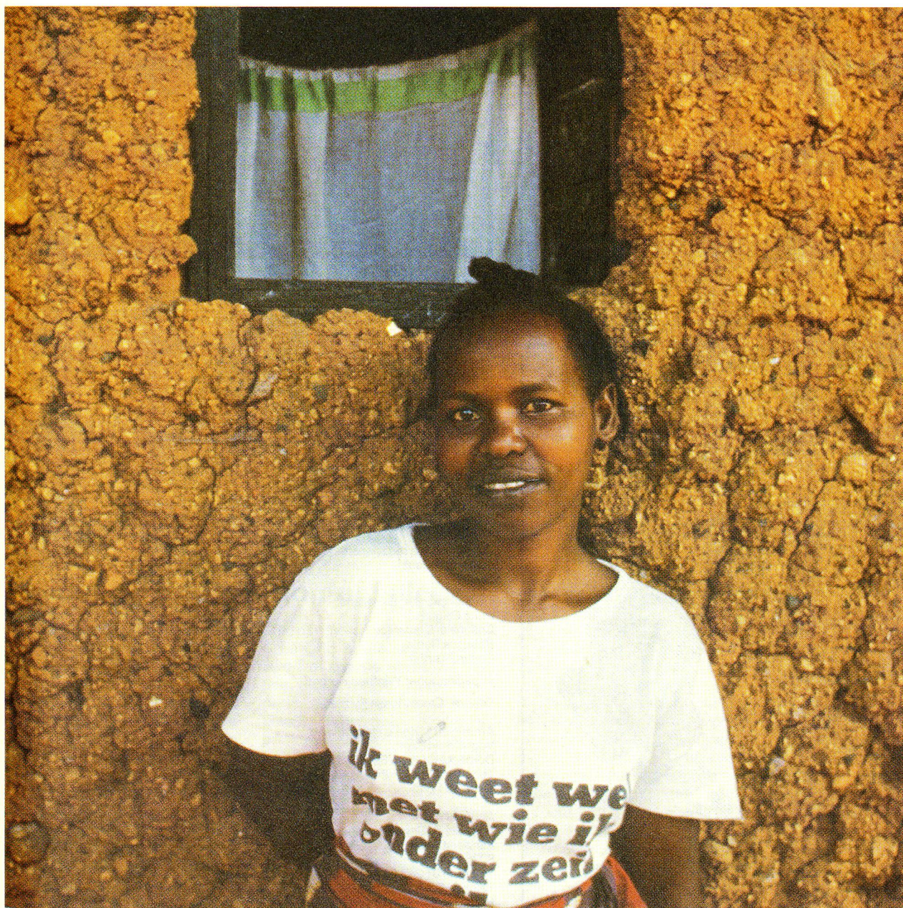
Rwanda: giovane donna di Kigali