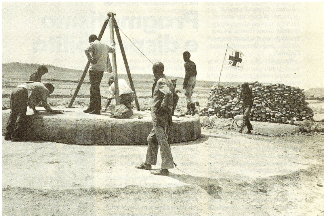
Etiopia: il CICR ha tenuto sotto controllo la situazione delle condizioni igieniche delle comunità eritree costruendo pozzi, latrine e sviluppando programmi di depurazione dell'acqua.

L'assistenza invece alla popolazione civile nelle zone vicine ai luoghi dove si combatte, specie nell'Ovamboland, il Kavango e la «banda di Caprivi», ha potuto essere parzialmente