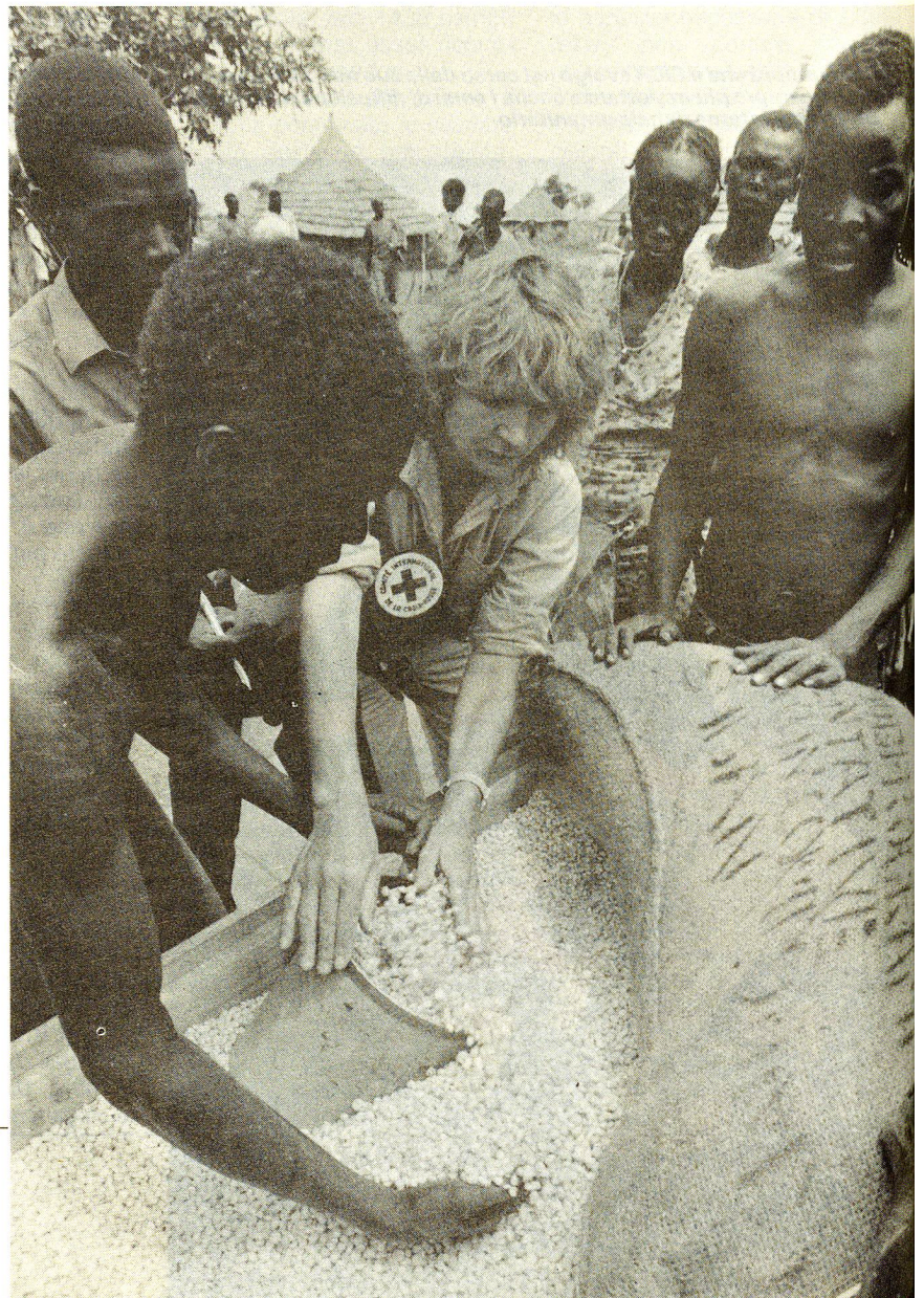
Sudan: distribuzione al campo di Agok nell'ambito di un programma alimentare e sanitario intrapreso nella zona.

Si ricorda inoltre che, in seguito alla sospensione della delegazione nazionale sud-africana da parte della XXV Conferenza Internazionale della Croce Rossa a Ginevra nel mese di ottobre, il governo di Pretoria aveva chiesto al CICR di cessare ogni attività in Sud Africa. Malgrado ciò, e grazie alle trattative intraprese dal Presidente del CICR, le autorità sudafricane sono tornate sulle proprie decisioni anche prima della data di scadenza imposta per la partenza dei de-