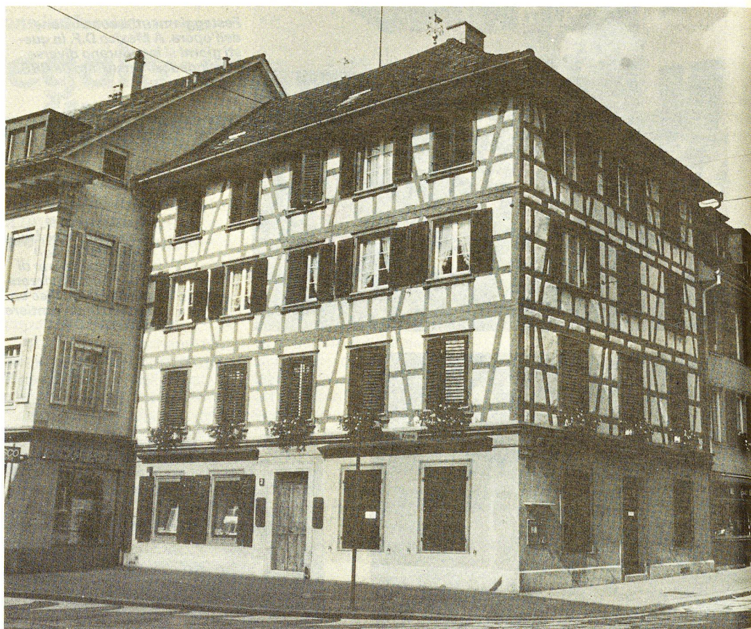
Cinque organizzazioni di soccorso dividono la bella casa a chiavistello della Metzggasse a Winterthur, una di queste è la sezione locale di Croce Rossa Svizzera.

Nel quadro dei festeggiamenti del centenario si sono organizzate delle dimostrazioni informative della sezione della Croce Rossa in collegamento con i membri delle associazio-