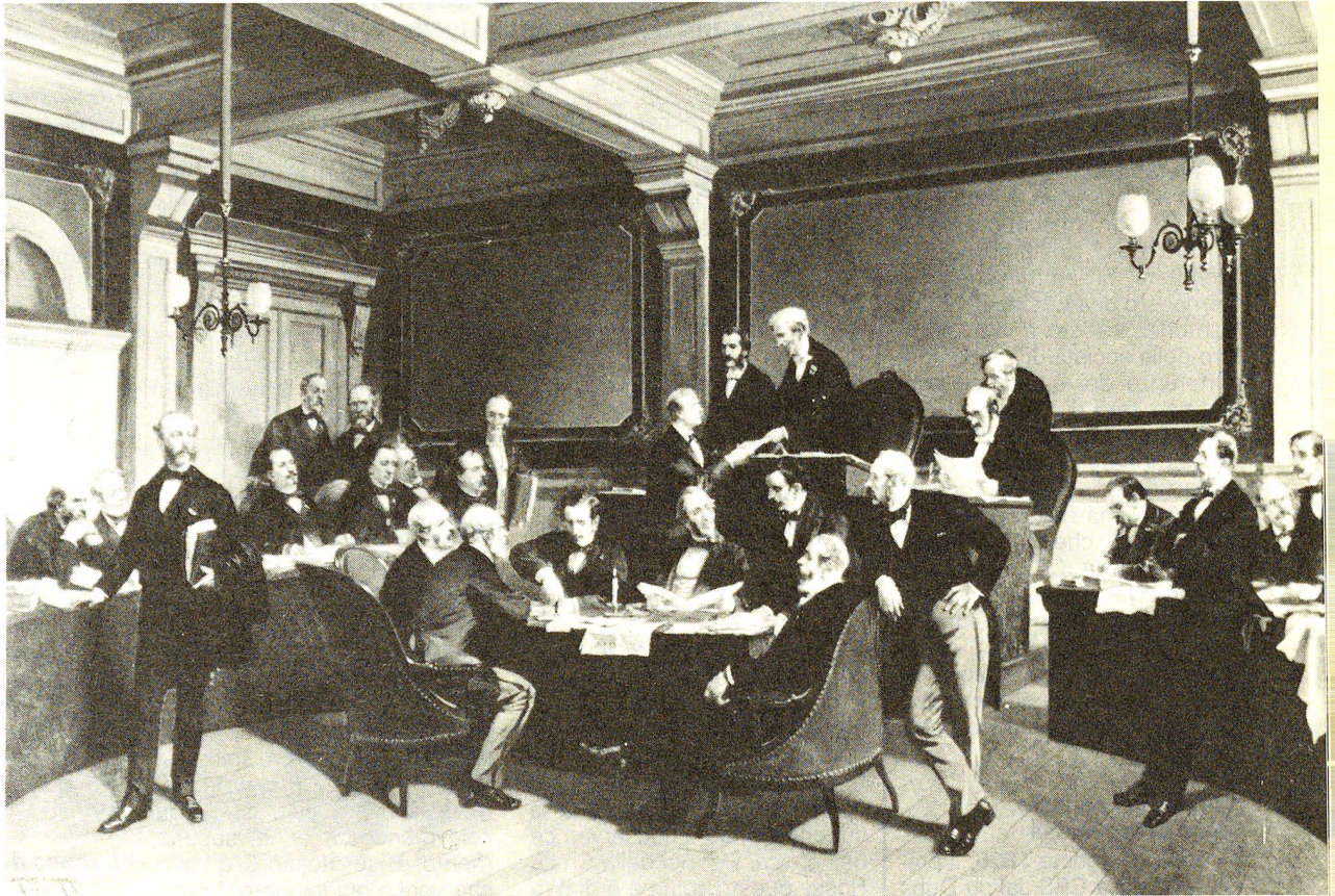
Firma della prima Convenzione di Ginevra della Croce Rossa per la protezione delle vittime di guerra, 22 agosto 1864. Il generale Dufour, presidente della Conferenza, consegna il documento a un delegato. Accanto a lui, Gustave Moynier.

tante della Società svizzera di soccorso, che si svolse durante la sessione, dal momento che gran parte dei 40 delegati erano deputati. Erano presenti circa 24 personalità di spicco (come li definì il quotidiano Basler Nachrichten nella sua edizione del 20 luglio 1866). Era il momento propizio per la fondazione di un comitato di questo genere, destinato ad affiancare il servizio sanitario dell'esercito: infatti in Germania imperversava la guerra, erano appena passate due settimane dalla battaglia decisiva di Königgrätz (3 luglio) e mancava una settimana all'armistizio di Nikolsburg (26 luglio) e cinque settimane alla pace di Praga (23 agosto 1866). Dufour si trovava nella capitale federale non solo in veste di con-