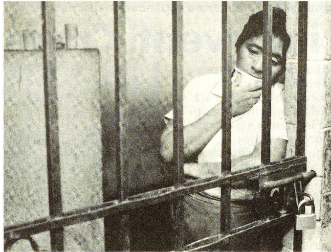
«Per i torturati il timore maggiore consiste nel sapere che nessuno conosce le loro condizioni.» Estratto dalla pubblicazione «Comitato Svizzero contro la tortura»

Perciò i promotori decisero di realizzare questa idea di Gautier prima in Europa, nella speranza che altre regioni del globo potessero seguire l'esempio. Nel 1982 il progetto per un accordo per un Comitato Europeo per la prevenzione della tortura, o di trattamenti e punizioni disumani e umilianti, venne sottoposto al Consiglio d'Europa. «Anche in questo caso», afferma il prof. Haug,