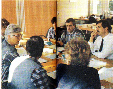
Il lavoro di gruppo dà spazio al dialogo e allo scambio di opinioni.

Inoltre, per l'anno 1988 sono previste riunioni a scopo informativo con temi particolari come le assicurazioni sociali, l'AIDS, la collaborazione internazionale e così via. I collabo-