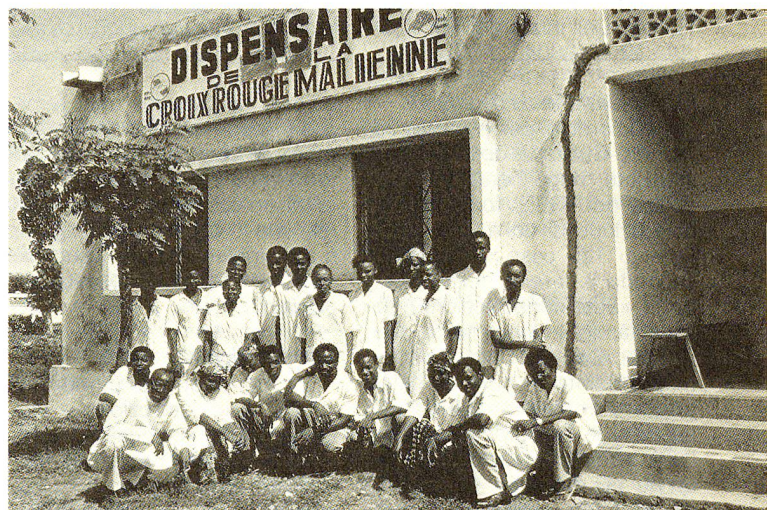
Dispensario di quartiere della Croce Rossa nella capitale del Mali, Bamako. I suoi collaboratori hanno tenuto in piedi il servizio anche in tempi difficili e con mezzi assai limitati.