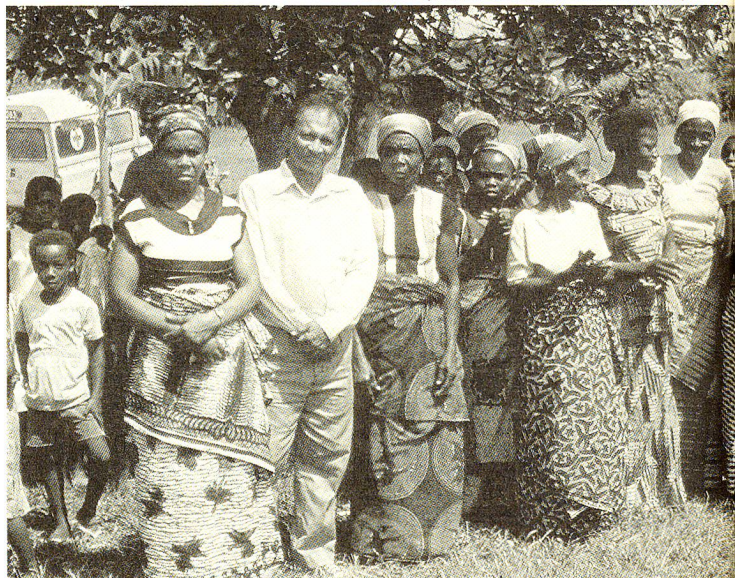
Foto di gruppo: socie del Club Croce Rossa delle Madri con un rappresentante della Croce Rossa. Sono donne che hanno una funzione importante nella prevenzione sanitaria delle zone rurali.

La fondazione di società Croce Rossa nella Guinea Equatoriale, nel Mali e nel Ghana procede lentamente, e ognuno dei programmi di sostegno segue il proprio corso prestabilito, dove giocano un ruolo preponderante la storia del Paese e della propria Croce