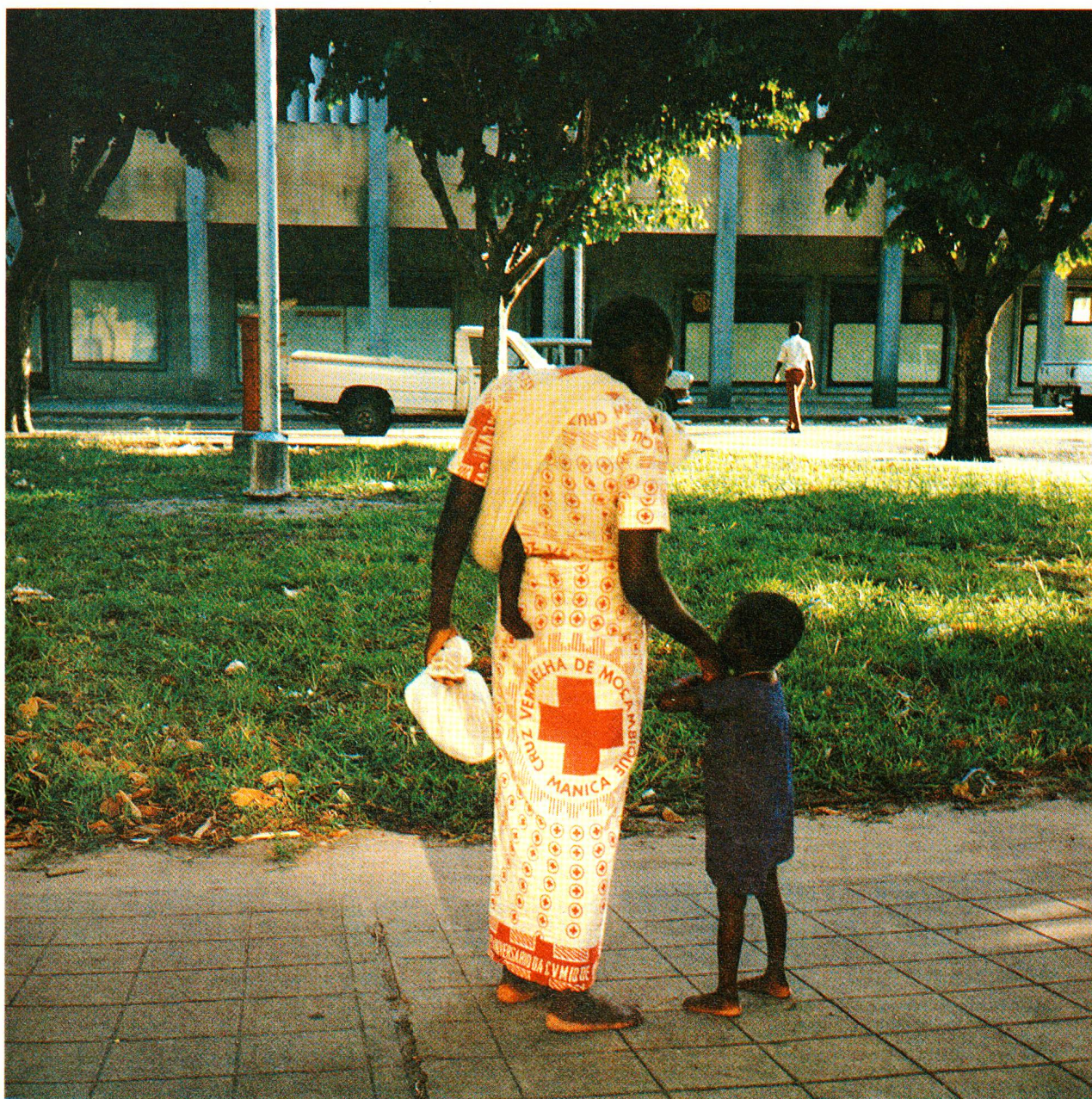
Mozambico: Croce Rossa come simbolo di quotidianità

Movimento Croce Rossa – Asilanti – Trasfusione di sangue nel terzo mondo