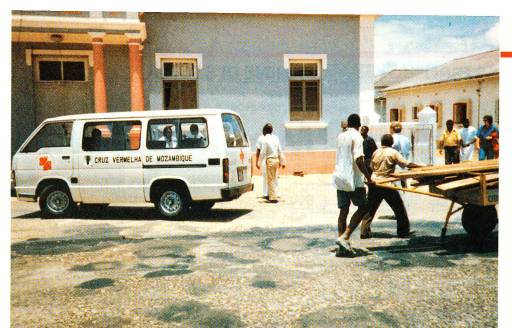
Un veicolo della squadra di donazione del sangue della «Cruz Vermelha de Moçambique», ovvero la Croce Rossa del Mozambico. Il mezzo di trasporto è stato consegnato oltre un anno fa da Croce Rossa Svizzera.

La donazione di sangue nei paesi del terzo mondo - L'esempio del Mozambico