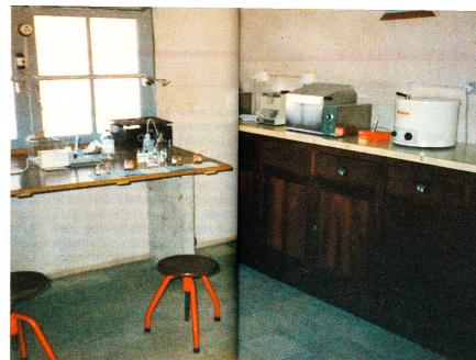
Il laboratorio nel centro dell'ospedale prof. di Inhambane è arredato ancora piuttosto modestamente.