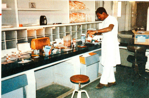
Laboratorio del centro nazionale di donazione del sangue a Maputo.