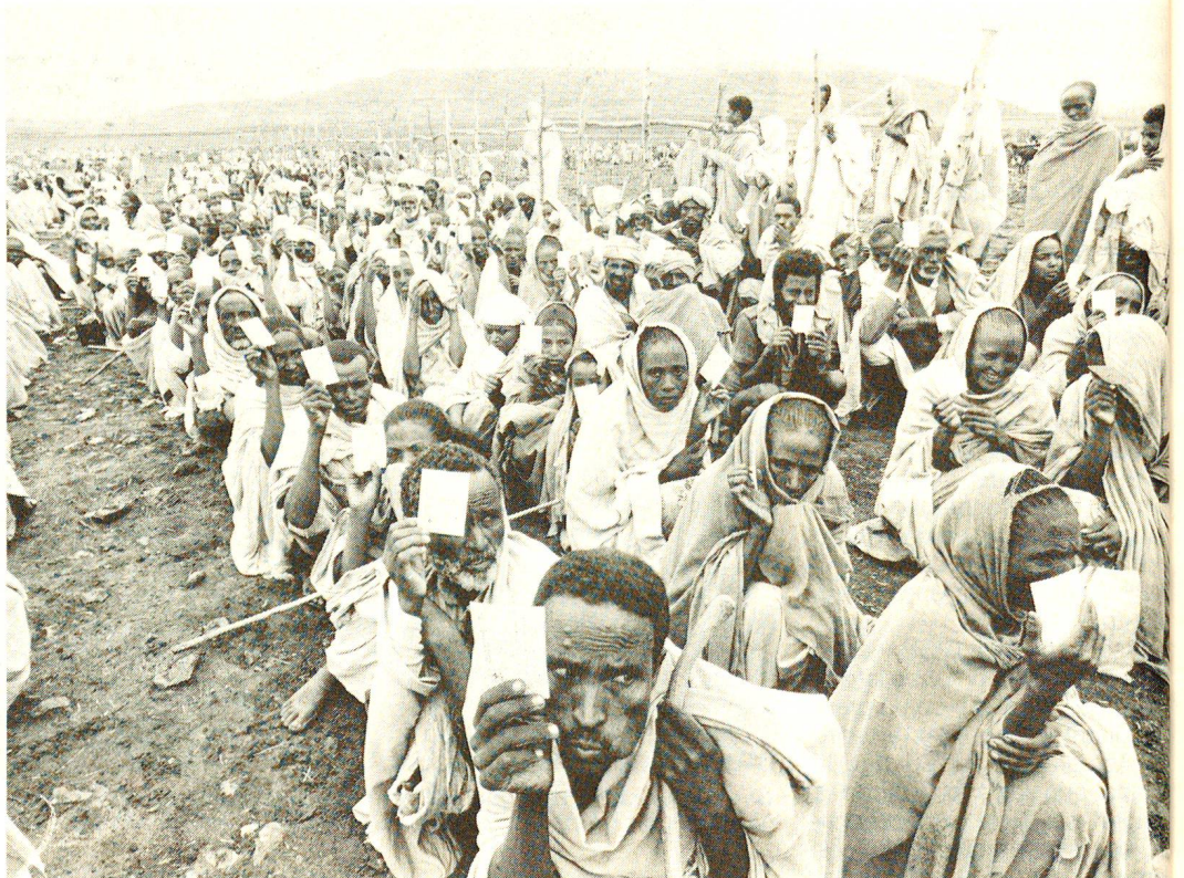
Etiopia 1985. Il CICR vuole evitare che nel 1988 questa situazione si ripeta.

Progetti di sviluppo di questo tipo non sono mai facili da realizzare: per di più in Etiopia un conflitto che non accenna ad avere fine, rende ancora più difficile la situazione. □