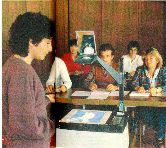
Corso di pronto soccorso. Il compito delle sezioni dei samaritani è quello di preparare la popolazione ad interventi di pronto soccorso.

vo, nel 1984 la Federazione svizzera dei samaritani entrò a far parte con tutti i diritti e doveri della famiglia della Croce Rossa. Questo passo è stato possibile grazie a una nuova visione del concetto di collaborazione, ossia che persone specializzate e volontari affrontino insieme i compiti che incombono alla Croce Rossa.