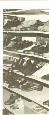
Metri di scaffalature coperte di calzature.

La sua filosofia dell'istituzione ne ha fatto una persona molto attiva durante le riunioni a livello superiore, un uomo che non esita a intervenire se ha qualcosa da dire. Sono già in diversi a indicarlo come possibile candidato per una carica più importante, ad esempio al Comitato centrale di CRS, cosa abbastanza plausibile.