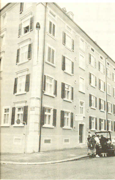
La Croce Rossa di La Chaux-de-Fonds, nell'appropriata sede in Rue de la Paix.

«Ma io ho rifiutato, perché mi porterebbe via troppo tempo. Non sono entrato nella Croce Rossa per ambizione, non ho intenzione di fare la scalata. Inoltre, vi è molta differenza tra il lavoro di una sezione e quello del Comitato centrale.»