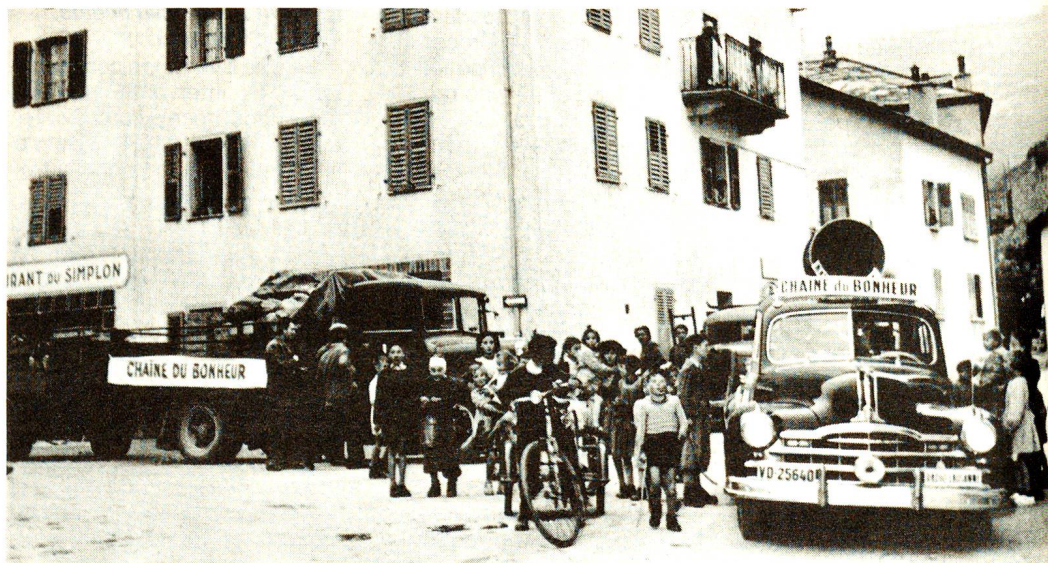
Foto d'archivio: autocarri della Catena della Solidarietà raccolgono i doni in natura offerti dagli ascoltatori.

e l'Europa erano appena uscite assai malconce da sei anni di orrori, odio e miseria. Era giunto il momento di portare conforto, di por mano alla ricostruzione.