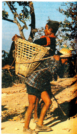
Lungo la strada per giungere all'«Eye Camp».