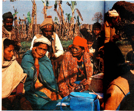
Finalmente arrivati! Pazienti che aspettano insieme ai loro accompagnatori di essere visitati.

vede, non è in grado di lavorare, e dipende dalla famiglia che in molti casi non può mantenerlo. Il povero non ha la possibilità di rivolgersi in tempo a un medico che eventualmente potrebbe evitargli la cecità totale; un quinto dei pazienti dell'«Eye Camp» di Padnaha, normalmente non ha nemmeno un tetto sotto cui ripararsi; gli altri vivono in una sola stanza con almeno un'altra dozzina di persone. Malattie degli occhi