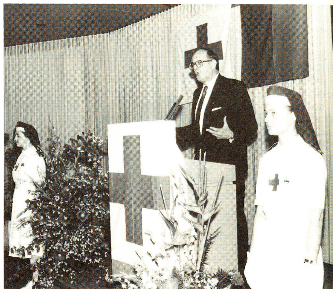
Con incisive parole, il presidente del Comitato internazionale della Croce Rossa (CICR), dott. Cornelio Sommaruga, ha aperto le celebrazioni promosse al Palazzo dei Congressi di Lugano, il 7 maggio 1988, per sottolineare il 125mo di fondazione della Croce Rossa.

Le quattro Convenzioni di Ginevra – ratificate da ben 165 Stati, sui 171 che conta attual-