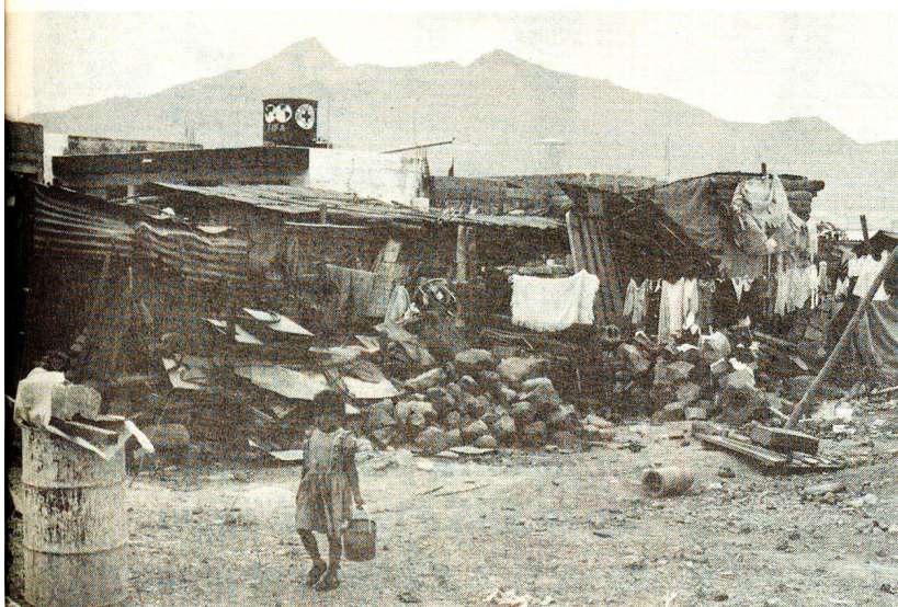
Messico, programma di aiuto alla ricostruzione intrapreso da CRS in collaborazione con la FIFA.