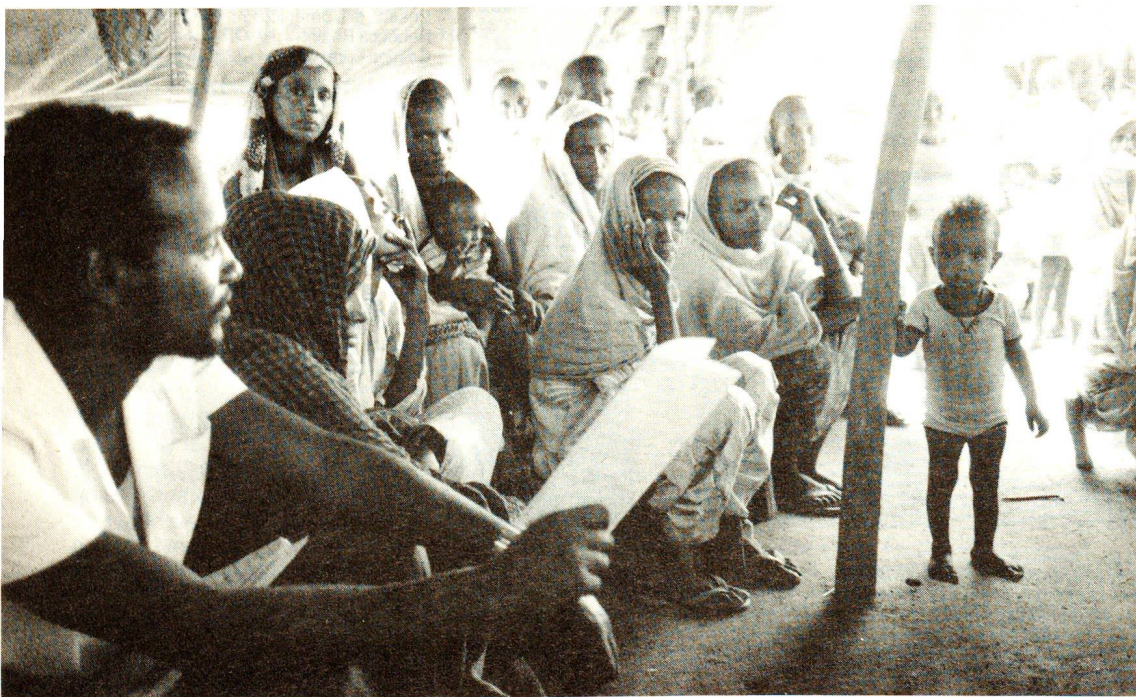
In un campo di profughi eritrei, nel Sudan, le mamme si riuniscono in una base medico-sanitaria per discutere i loro problemi con i responsabili di CRS.