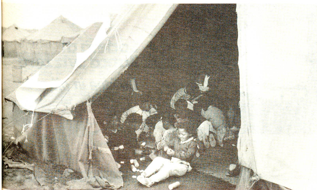
Nelle tendopoli installate per accogliere profughi, sfollati ed espatriati, i responsabili di Croce Rossa Svizzera intraprendono adeguati controlli sanitari e nutrizionali sui bambini, per i quali la vita nella tenda diviene comunque uno spensierato momento socializzante.

Guinea Equatoriale CRS promuove lo sviluppo delle società nazionali della Croce Rossa dando loro in tal modo la possibilità di estendere su tutto il territorio nazionale le attività in campo sanitario e sociale, nonché quelle relative al salvataggio e all'aiuto in caso di catastrofi.