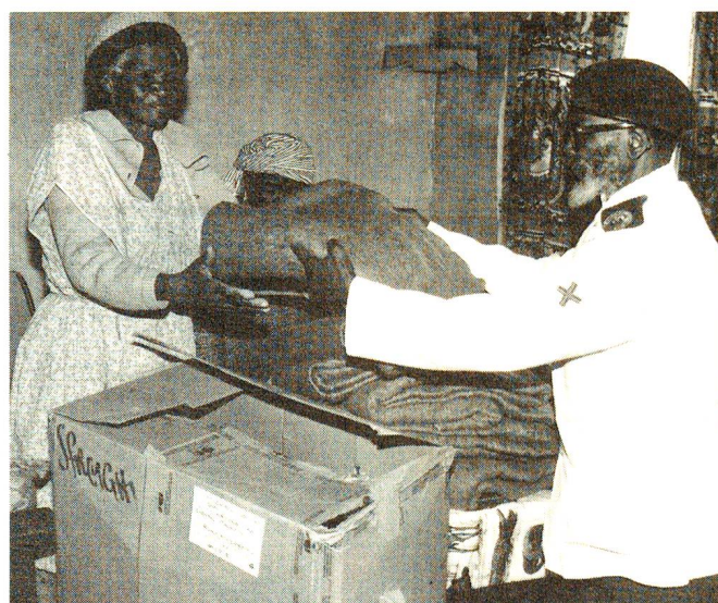
In qualsiasi Paese in cui CRS è presente, viene data la priorità alle operazioni che coprono i fabbisogni elementari delle popolazioni.