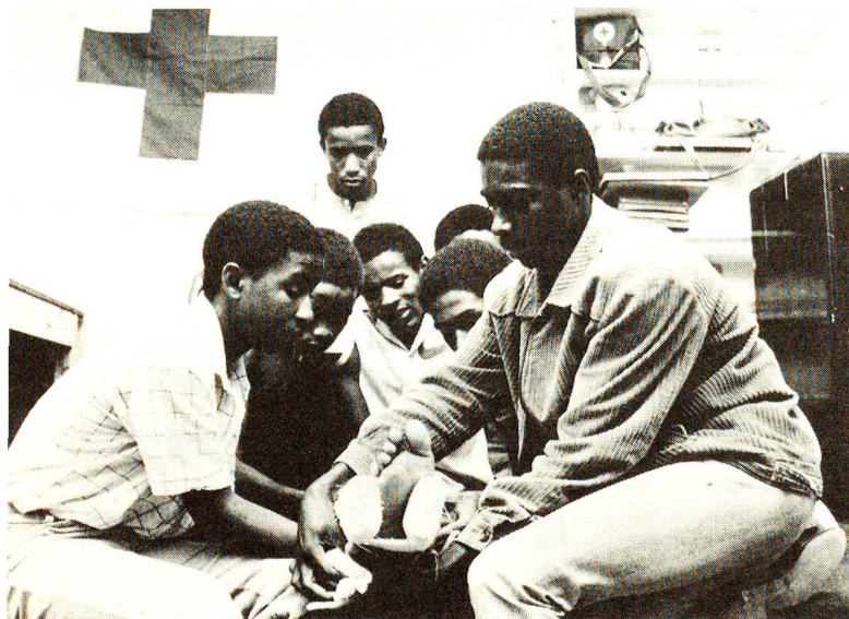
Africa: CRS promuove lo sviluppo di società nazionali della Croce Rossa, società che s'impegnano ad attuare programmi nell'ambito sanitario. Nella foto, corso di soccorritore d'emergenza.

In stretta collaborazione con gruppi locali, in Bolivia CRS sta attuando progetti in campo sanitario che includono soprattutto l'impiego delle piante medicinali. Sono stati inoltre portati a termine i programmi sanitari a lunga scadenza rea-