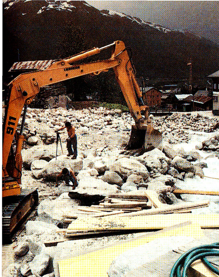
Nel letto del torrente vengono impiegati pesanti macchinari di costruzione. Scavano nel Münstiger un nuovo canale di deflusso.