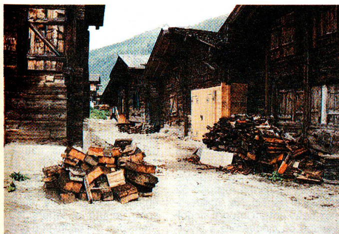
I nuovi balconi chiari risaltano accanto a quelli scuri che hanno resistito all'inondazione.