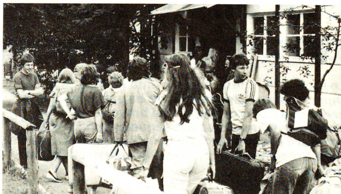
Lenk 1982. Arrivo di fronte alle barache militari di Lenk, dove per 17 anni si sono svolti i campi d'informazione per le professioni curanti.