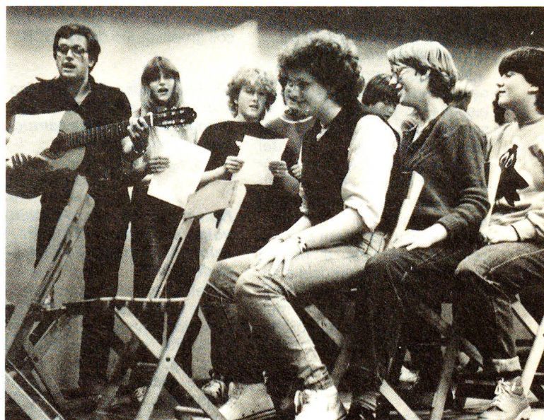
Lenk 1982. Insieme anche durante il tempo libero.