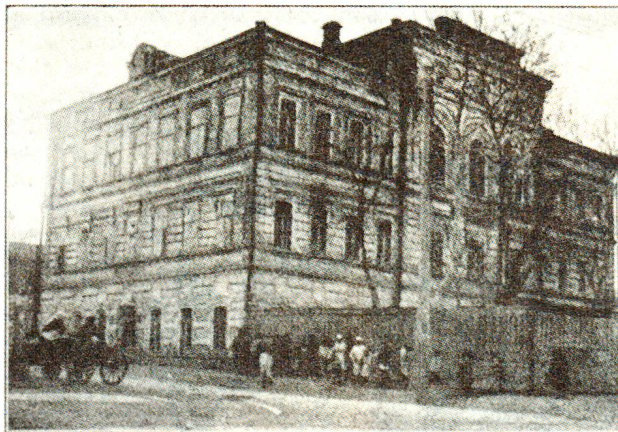
Tsaritsyne: uno degli asili per bambini abbandonati gestito dalla missione svizzera.

Di fronte all'ampiezza del disastro, il Governo sovietico cercò di reagire. Tra l'altro, ordinò il trasferimento di migliaia di abitanti della zona disastrosa verso la Siberia e curò l'arrivo di cereali. Ma soprattutto, mise in opera la «NEP», la «Nu-