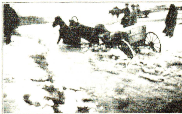
Difficoltà di trasporto dei pazienti nella steppa invernale.

In una circolare alle sezioni e alle istituzioni ausiliarie, in data