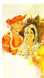
Copertina di Aldo Ripamonti riprodotta dal romanzo «Il Nababbo», pubblicato dal Club del Libro, Euroclub.

L'ultimo dei tre opuscoli illustranti la storia della Croce Rossa verrà pubblicato a novembre e conterrà il bando per un concorso. I vincitori verranno premiati con i disegni originali che colorano la storia stessa, disegni firmati da Aldo Ripamonti, artista milanese, il quale ha appunto curato la parte illustrativa. Coloro che fossero interessati agli opuscoli (16 pagine ciascuno, formato 10,5x21) e non avessero ricevuto il terzo entro novembre, possono rivolgersi a Croce Rossa Svizzera, servizio relazioni pubbliche, Raimattstrasse 10, 3001 Berna. Gli inviti di questa iniziativa, alla quale ciascuno può aderire secondo le proprie disponibilità, serviranno a potenziare le attività di carattere assistenziale di Croce Rossa Svizzera.