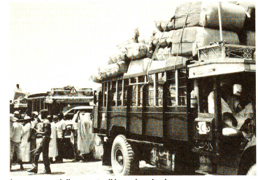
La consegna delle coperte di lana si svolge in un'atmosfera estremamente tesa. Per non perdere il controllo della situazione sono molto importanti efficienza e precisione.

Gli abusivi non vivono su un territorio privilegiato, ma si insediano nelle zone più basse e quindi maggiormente esposte alle inondazioni oppure nelle vicinanze di enormi scarichi di rifiuti alle porte della città. Qui,