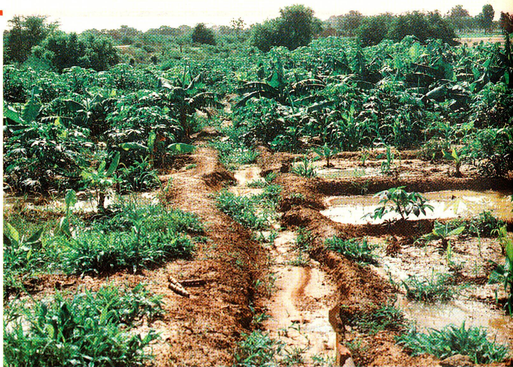
Il comitato della Croce Rossa di Koulikoro è riuscito a mettere a disposizione di 25 famiglie povere, 2,5 ettari di terra fertile. Le singole parcelle vengono irrigate regolarmente con l'acqua del Niger.