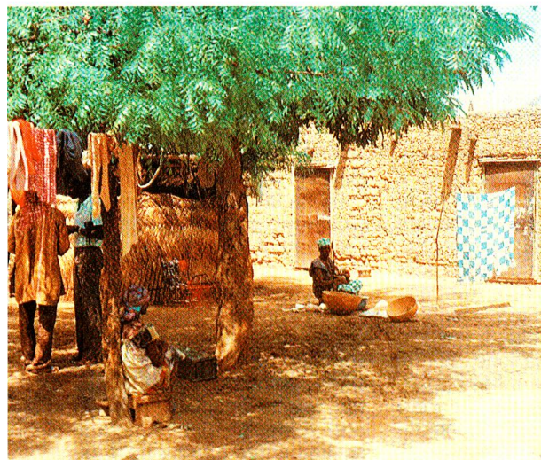
In questo cortile si svolge la vita della famiglia Diarra. Sullo sfondo si nota la casa.