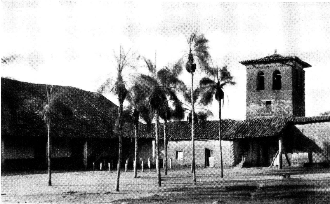
Innenhof der Mission San Miguel (Bolivien), erbaut im 18. Jahrhundert. Auch diese Kirche wurde von P. M. Schmid mit Altären versehen.

Geräte für den Kult; da standen Webstühle zur Bereitung von Wollstoffen; Tischlerei und Schmiede lieferten treffliche Arbeiten 14 .