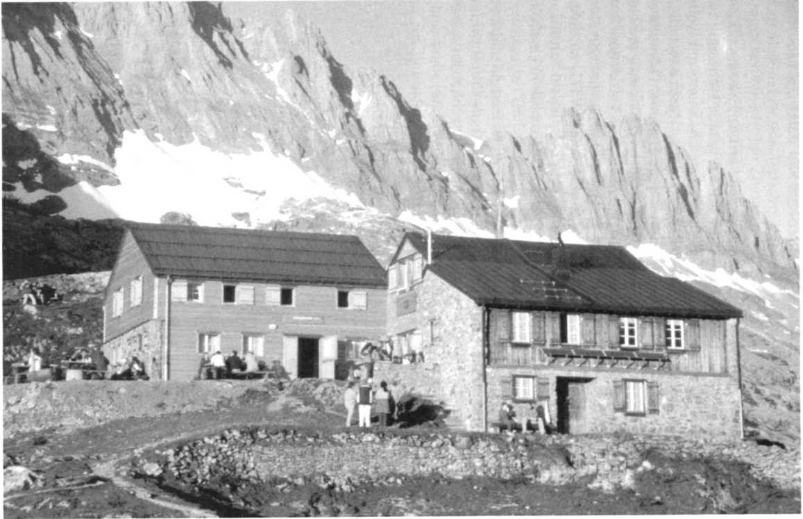
Die Windgällenhütte mit dem neuen, zweistöckigen Anbau, der das Schlafplatzproblem löst.