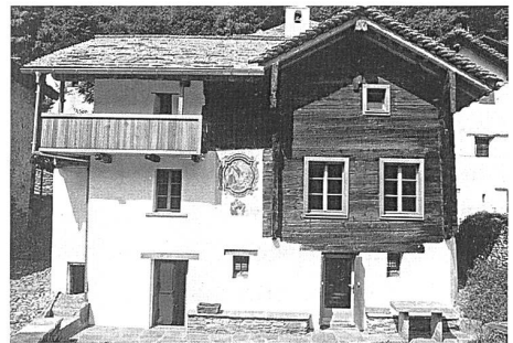
Abb. 63: Soazza, Casa San Floriano Nr. 111. Restaurierte Hauptfassade.

221; Sent, Haus Clalüna-Valentin Nr. 145; Soazza, Casa a Marca, Nr. 108; Stampa, Maloja, Orden, Hof Salecina; Stampa, Splüga, Stall Salis Nr. 162; Vals, Heimatmuseum Gandahus; Vals, Leis, Haus Schmid Nr. 202; Vals, Zameia, Wohnhaus mit Stallteil Nrn. 70, 70A.