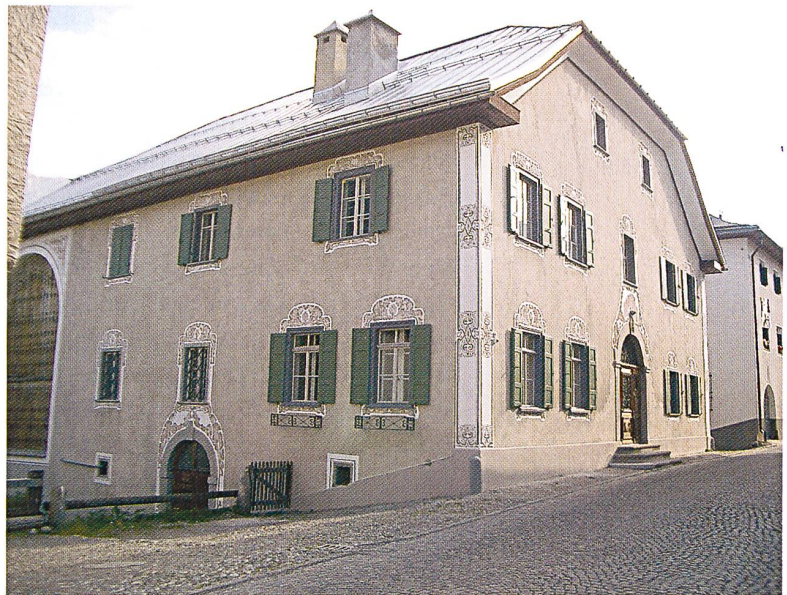
Abb. 64: S-chanf, Haus Plattner Nr. 32, nach der Restaurierung. Blick gegen Südwesten.

Im Jahr 2004 gingen 89 Beitragsgesuche ein. Die Regierung sicherte zehn Gesuchstellern einen Beitrag zu. Das Departement erliess 17 Beitragsverfügungen, das Amt deren 62. Insgesamt wurden aus den Konten der DPG Fr. 2 209 114.– zugesichert. Zur Auszahlung gelangten Fr. 3 400 427.–.