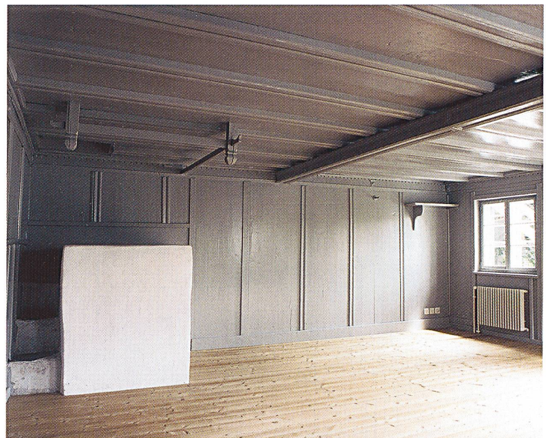
Abb. 60: Flims, Waldhaus, Posta Veglia Nr. 190. Stube mit Ofen im Erdgeschoss, nach der Restaurierung.

vretga, Haus und Stallscheune Nr. 172, 172A; Braggio, Mazö, Lavatoio Nr. 70A; Braggio, Stabbio, Heustall Nr. 63; Cama, Grotti, Deposito Tini Nr. 49A; Chur, Haus zum Schwert; Davos, Glaris, Mahdställi in den Leidbachmähdern; Davos, Glaris, Spina, Stallscheune Nr. 3-79-D; Davos, Platz, Tanzbühlstrasse Nr. 6, 6A; Flerden, Haus Allemann Nr. 28; Flerden, Plattas, Grossbrunnahus (Marchionhaus) Nr. 33; Guarda, Haus von Planta Nr. 68; Haldenstein, Transformatorstation Nr. 68; Madulain, Chesa Etter Nrn. 33, 33B; Mesocco, Logiano, Haus Mazzolini/Pagliese, Nr. 365; Poschiavo, San Carlo, Casa Volt Nr. 474; Rossa, Valbella, Cascina Fani Nr. 115; Rossa, Valbella, Torba Nr. 113B; Roveredo, San Giulio, Haus Cattaneo Nr. 438; St. Martin, Lunschania, Haus Albin Nr. 48; Safien, Camaner Hütte, Alphütte Lötscher-Meuli Nr. 166A; S-chanf, Haus Plattner Nr. 32; Schlans, drei Backhäuser; Selma, Ripostiglio Fischer Nr. 17A; Sent, Haus Biert Nr.