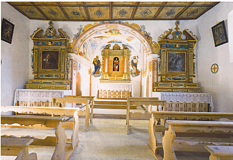
Abb. 85: Riom-Parsonz, Salaschings, Kapelle St. Bartholomäus. Blick in den Chor, nach der Restaurierung. Zustand 2004.

Die Seitenaltäre haben beide denselben Aufbau (Abb. 85): Über einem gemauerten Stipes steht jeweils ein hölzerner Aufsatz, der einen architektonischen Rahmen um