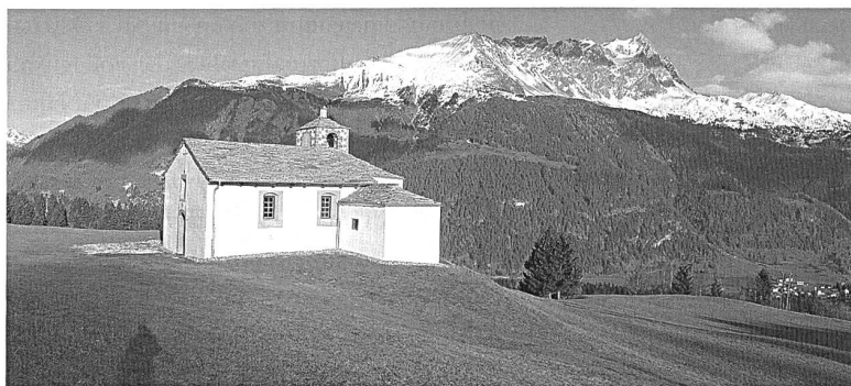
Abb. 81: Riom-Parsonz, Salaschings, Kapelle St. Bartholomäus. Nach der Restaurierung. Zustand 2004. Blick gegen Nordosten.

Die Öffnungen im Bereich des Chores und der Sakristei, in welchen ehemals womöglich Ankerbalken zur Verstärkung der Chormauern sasssen, 146 belies man offen,