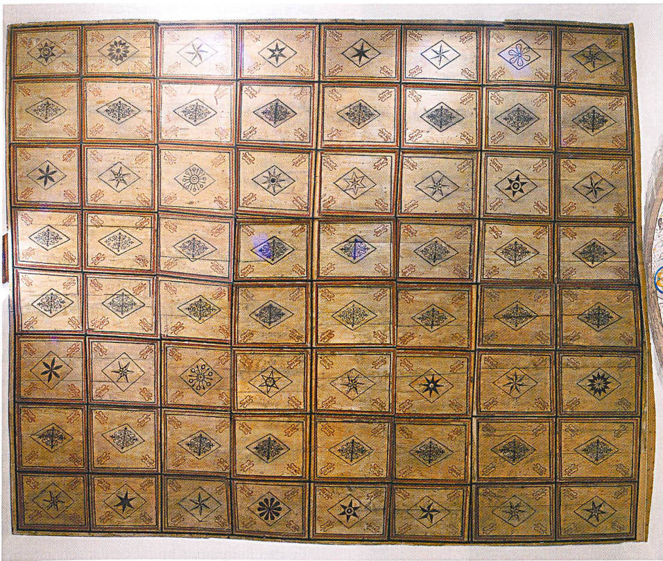
Abb. 83: Riom-Parsonz, Salaschings, Kapelle St. Bartholomäus. Felder- decke im Schiff.

legen. Der von der Restaurierungsfirma Jörg und Curdin Joos, Andeer, durchgeführte Versuch zeigte ein gutes Ergebnis. Da der finanzielle Aufwand für eine komplette Aufdeckung der älteren Fassung die Mittel der Stiftung St. Bartholomäus überstieg, galt es, neue Geldquellen zu finden. Es wurden Gönner und Gönnerinnen gesucht (und gefunden), die bereit waren, die Kosten für eine oder mehrere der insgesamt 64 Tafeln zu übernehmen.