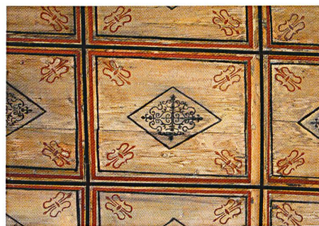
Abb. 84: Riom-Parsonz, Salaschings, Kapelle St. Bartholomäus. Felder- decke im Schiff, Detail.

Nach der Freilegung zeigt die Decke folgendes Bild (Abb. 83): Die einzelnen, durch profilierte Holzleisten definierten Felder weisen eine breite äussere Rahmenlinie in Rot auf. Das innere Feld hat einen Hintergrund aus naturbelassenem Holz. Es ist mit einer feineren schwarzen Linie eingefasst. In den Ecken